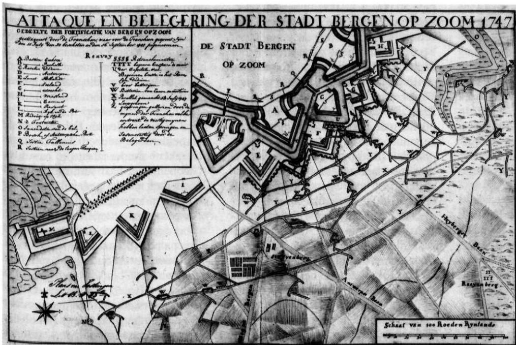
Afb. 2 'Attaque en belegering der stad Bergen op Zoom 1747'

Op deze plattegrond zijn duidelijk de vier opeenvolgende parallellen zichtbaar, die door de Fransen evenwijdig aan het aangevallen front werden gegraven. Zij zijn met elkaar verbonden door zigzag-loopgraven, dit om enfilierend vuur te voorkomen. Vanuit de vierde of voorste parallel, naderen de belegeraars met sappen (smalle, onmiddellijk op de juiste diepte aangelegde loopgraven) de lunetten in de bedekte weg. De cunette is zichtbaar in het midden van de droge gracht.